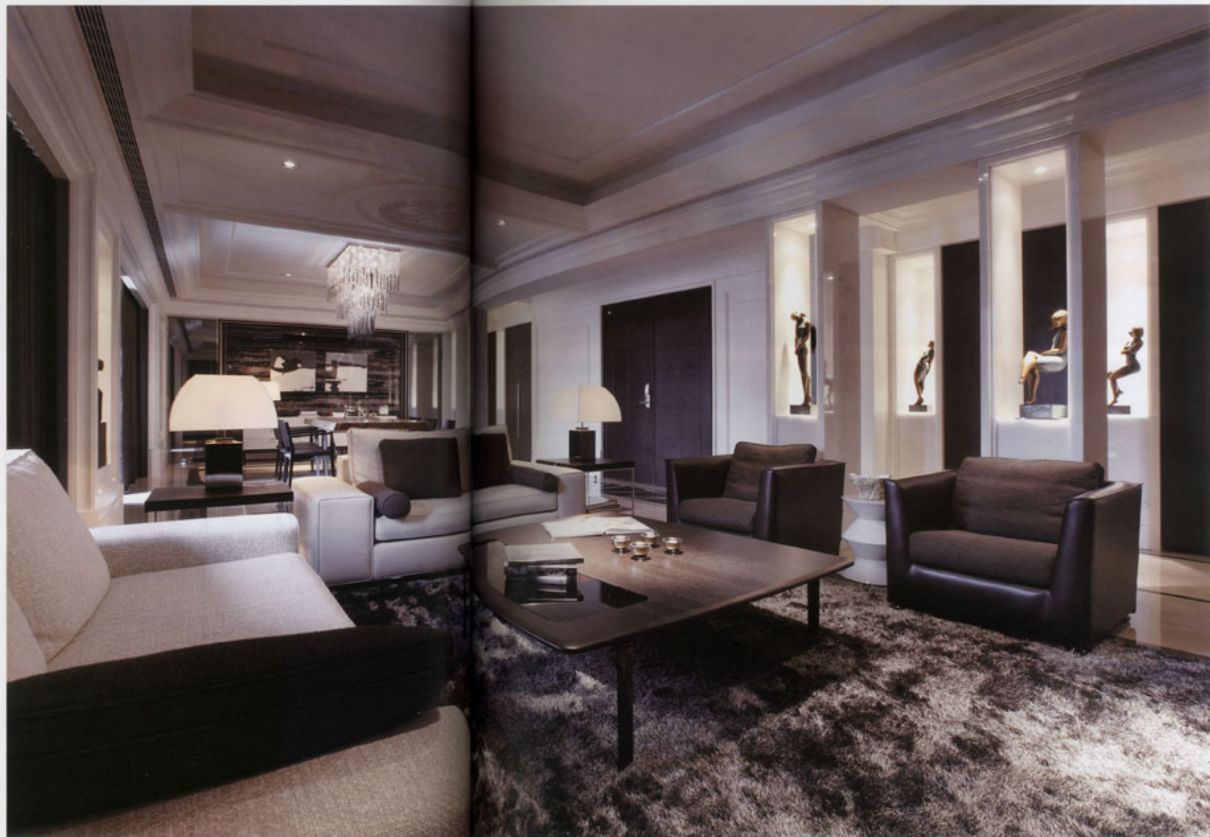
图1 客厅 客厅采用沙发、台灯等软饰与餐厅进行半隔断, 相较于走廊营造出的艺术氛围, 它更注重质感的细腻处理与视野的开阔性。