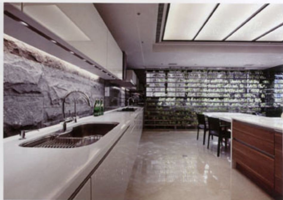
图3 餐厅 来自顶层叠叠奢美吊灯的光，洒落如星辰，落于餐厅内，虽不及地面反光，但木质的自然本色，却能中和光感的变化。

本案的空间布局对称，自玄关而入，特设了两列艺术廊道，以对应客厅、餐厅的空间界定。以玄关作为中轴线，左侧是厨房、主卧，右侧则为客卧、女儿房、男孩房。意境与实境的大明大放，设计师在白天运用自然光，晚上则用设定光源，以渲染空间的层次，为本案造型制造对应与反差的关系。如此，家不再只承担居住功能，经过特别设计，它所建构的场所可随时而与自然、与环境融为一体，延伸出一场串联与展开的对应概念；同时，藉由穿透、对应的概念在空间中生出明与暗、内与外、静与动、开放与隐秘等一系列关系，创造出不同空间轴线的重组与开阖。