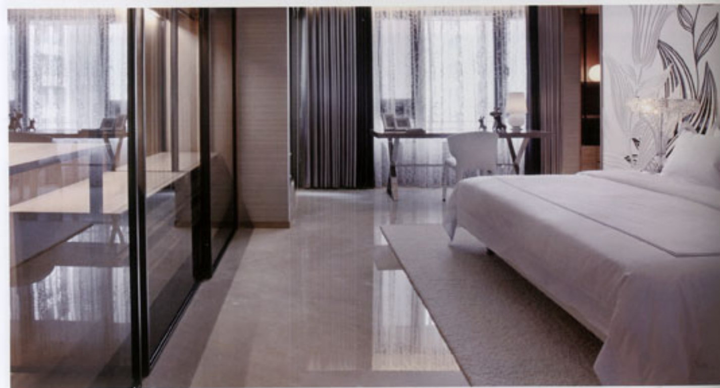
图6 主卧 颠覆四柱床的构架。设计师将纱幔从天花板垂而下，带来改良式的东方风情。一面墙以石材饰面，从主卧延续至浴室，颇有度假型酒店公寓的情调。 图7 女儿房 在设计女儿房时，设计师注入了更多的暖性因素，譬如床头背景墙的黑白面纹的花朵、玻璃装饰的台灯等，传达出小女儿心态的单纯与率性。 图8、9 主卧卫浴间 与主卧相连的卫浴间，同时也是健身房。香薰、浴缸“偷安一角”，配置的Bloom花椅，玻璃镜框的油画，服务于空间布局的同时，也流露出东南亚与美式空间美学。